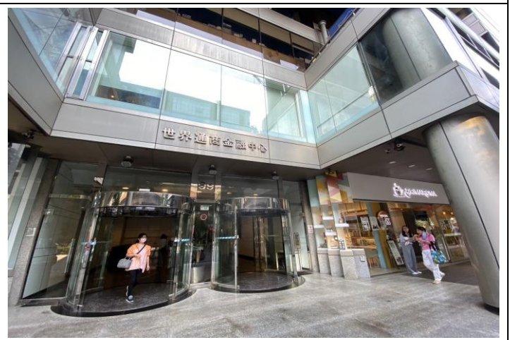
6.大門-世界通商金融中心(台北市復興北路 99 號)