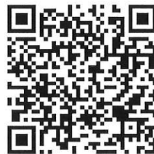
過往六福永續獎影片